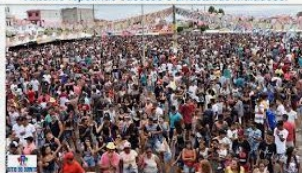
Prefeitura de Sítio do Quinto realiza 30ª Alvorada de Santo Antônio repetindo sucesso e arrastando multidões.

Santo Antônio de Pádua. Ao longo da trezena, a Paróquia de Santo Antônio de Pádua, realiza uma verdadeira ação de fé, religiosidade e devoção. Além da trezena religiosa, o município realiza nessa época, uma grande festa nordestina, com diversas ações que visam destacar a cultura local. No primeiro dia de festa, o município realiza a tradicional Alvorada, às 5h da manhã, importante festa que traz turistas de diversos estados brasileiros para comemorar a abertura